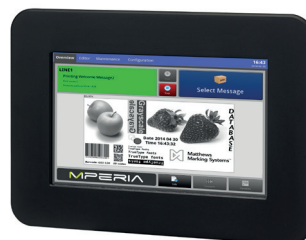
MPERIA™ Standard HE

Aangezien Matthews Marking Systems voortdurend verbeteringen doorvoert aan zijn producten, behoudt het bedrijf het recht voor om het design en/of de specificaties zonder voorafgaande kennisgeving te wijzigen. © 2014 Matthews Marking Products