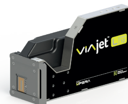
VIAjet™ L-Series L12-printkop